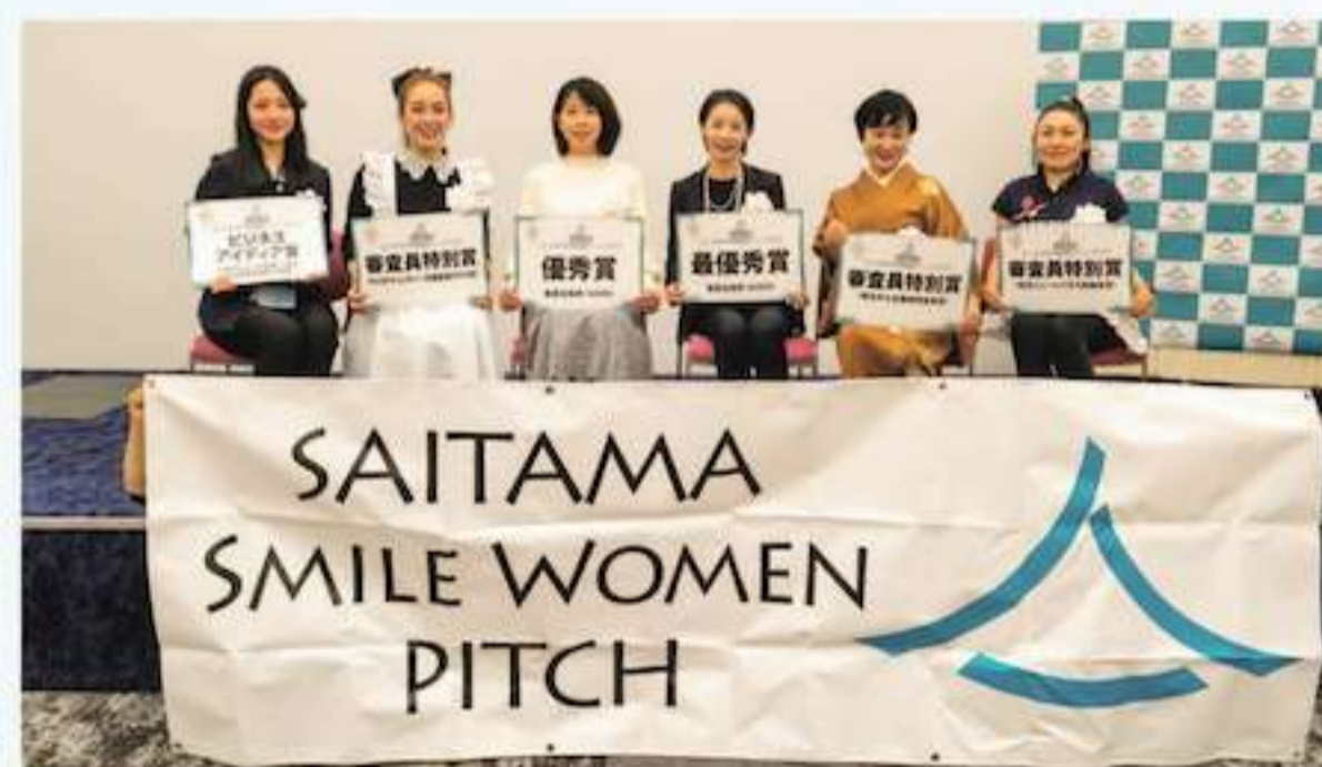
ファイナリスト表彰