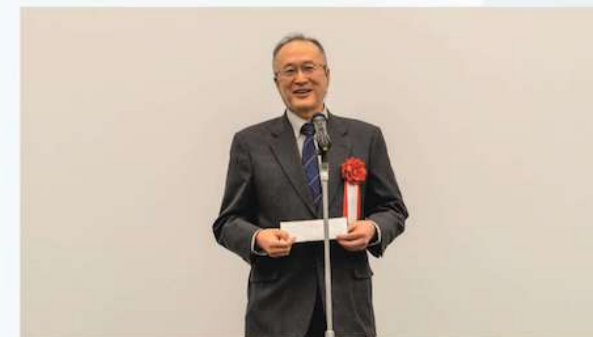
審査員長(国立大学法人埼玉大学 坂井貴文学長)による総評