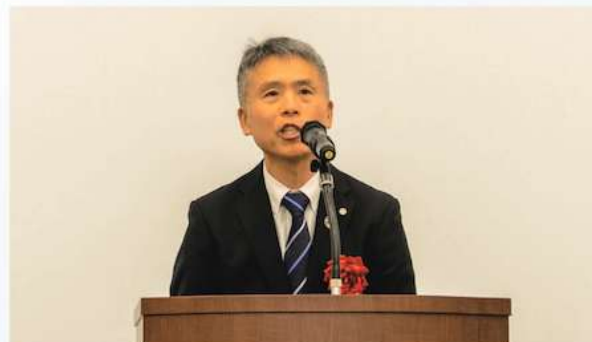
埼玉県産業労働部産業政策局長による開会の挨拶

元テレビ埼玉アナウンサー。 埼玉県春日部市出身。成城大学 経済学部卒業。一般企業へ就職後、アナウンサーの道へ進む。 現在は結婚、出産を経てフリーへ。各メディア出演、各種イベント、ウエディング司会、映像ナレーションなどの活動を行っている。