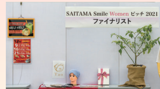
SAITAMA Smile Women ピッチ2021 ファイナリスト