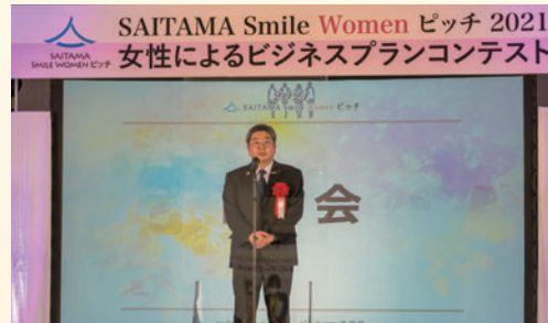
埼玉県産業労働部長による開会の挨拶

県内団体による、子どもたちの創業体験とビジネスプラン発表。子どもたちがSDGs (持続可能な開発目標) の視点で「あったらいいな」と思うビジネスアイデアを考えました。