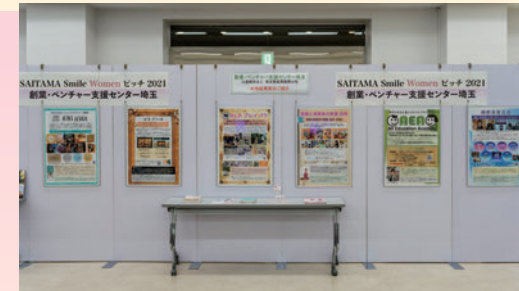
創業・ベンチャー支援センター埼玉①