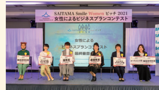
ファイナリスト表彰