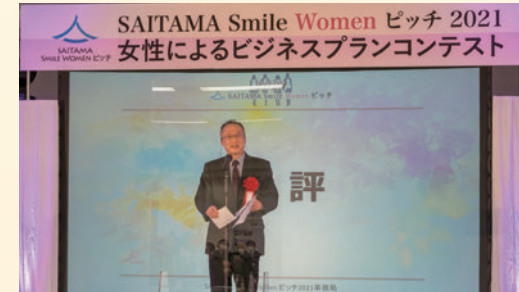
審査員長 (国立大学法人埼玉大学 坂井貴文学長) による総評