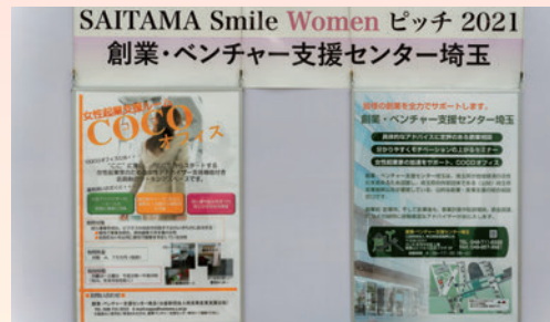
創業・ベンチャー支援センター埼玉②