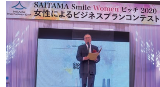
審査員長(国立大学法人埼玉大学 坂井貴文学長)による総評