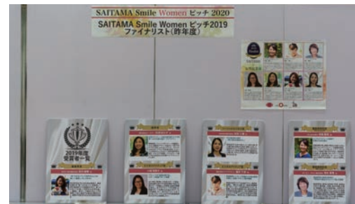
SAITAMA Smile Women ピッチ2019 ファイナリスト(昨年度)