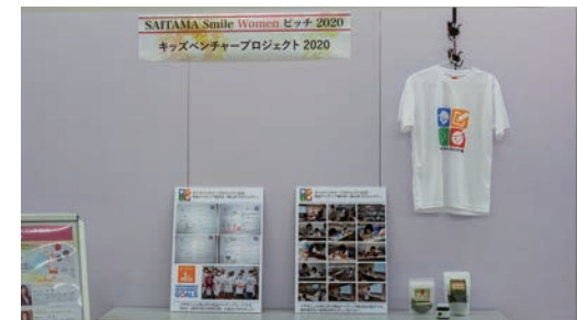
キッズベンチャープロジェクト2020