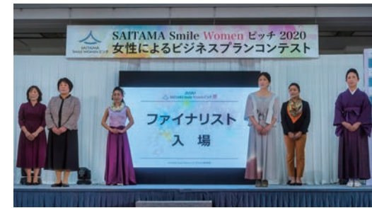
ファイナリスト登壇