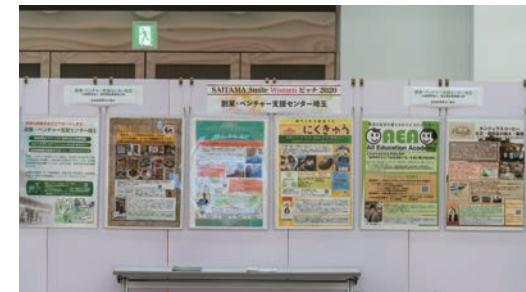
創業・ベンチャー支援センター埼玉