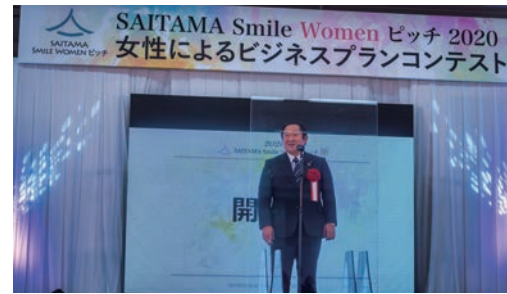
埼玉県産業労働部長による開会の挨拶

社会や人の役に立つことをテーマに「あったらいいな」と思うお店・サービスのアイデアを基に埼玉県の特産品「狭山茶」で商品開発を行いました。アイデアについて、SDGs(持続可能な開発目標)の視点で考えました。